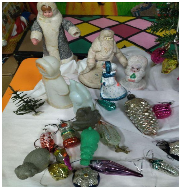
Дед Мороз и Снегурочки