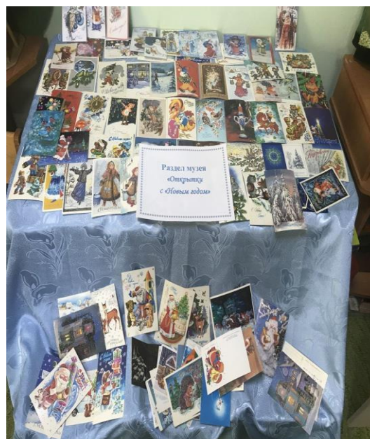
Раздел музея «Открытки С Новым Годом»