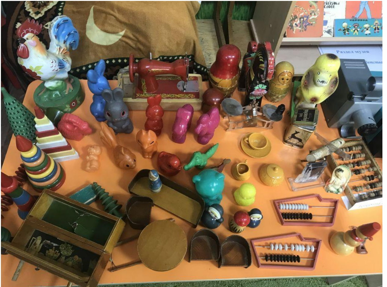
Игрушки вещи из бабушкиного сундука