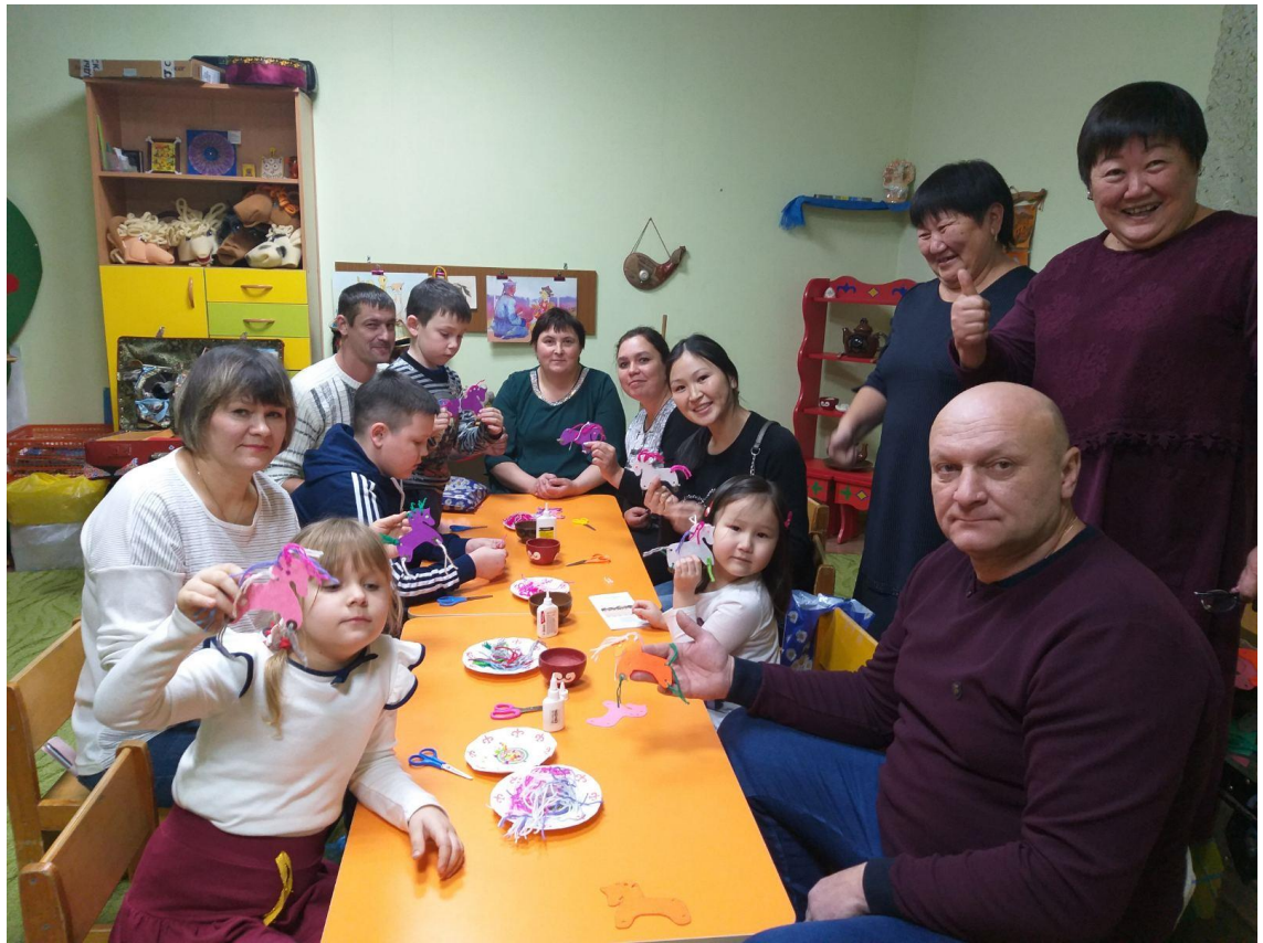
Мастер-класс с детьми и родителями «Ульгэрэй морин» («Сказочные лошадки»)