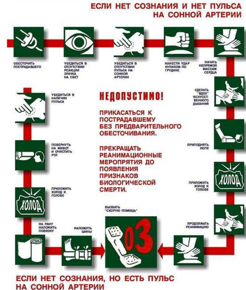
СХЕМА ДЕЙСТВИЙ В СЛУЧАЕ ПОРАЖЕНИЯ ЭЛЕКТРИЧЕСКИМ ТОКОМ