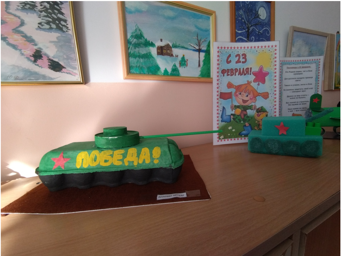
Лэпбук «Наша армия родная»