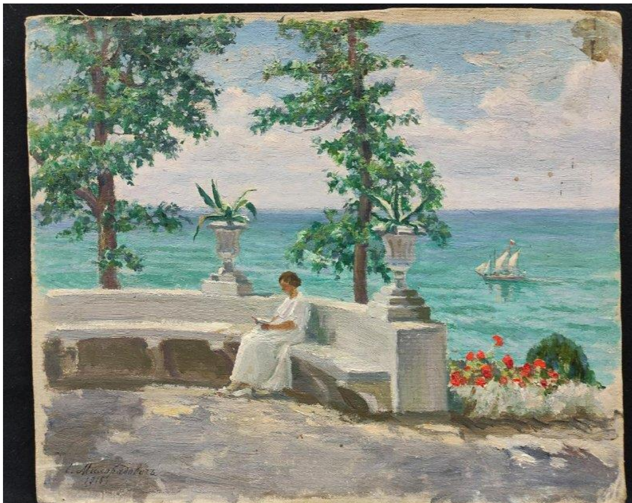
"Летом у Чёрного моря", С.Д. Милорадович, 1916. Симферопольский художественный музей.

Милорадович был наиболее известен своими историко-религиозными картинами, но кроме них он также создавал живописные произведения в бытовом и портретном жанрах, изредка встречаются в его творческом наследии и пейзажи.