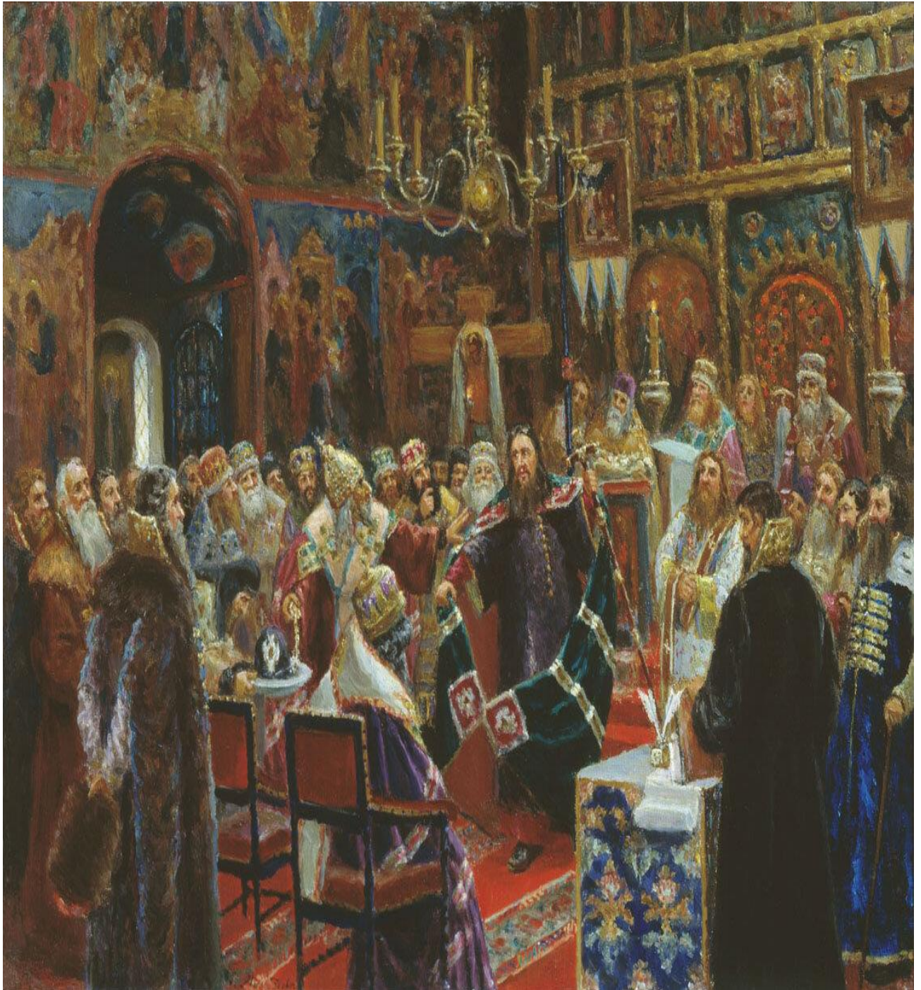
"Суд над патриархом Никоном", С.Д. Милорадович. Музей истории религии, Санкт-Петербург.