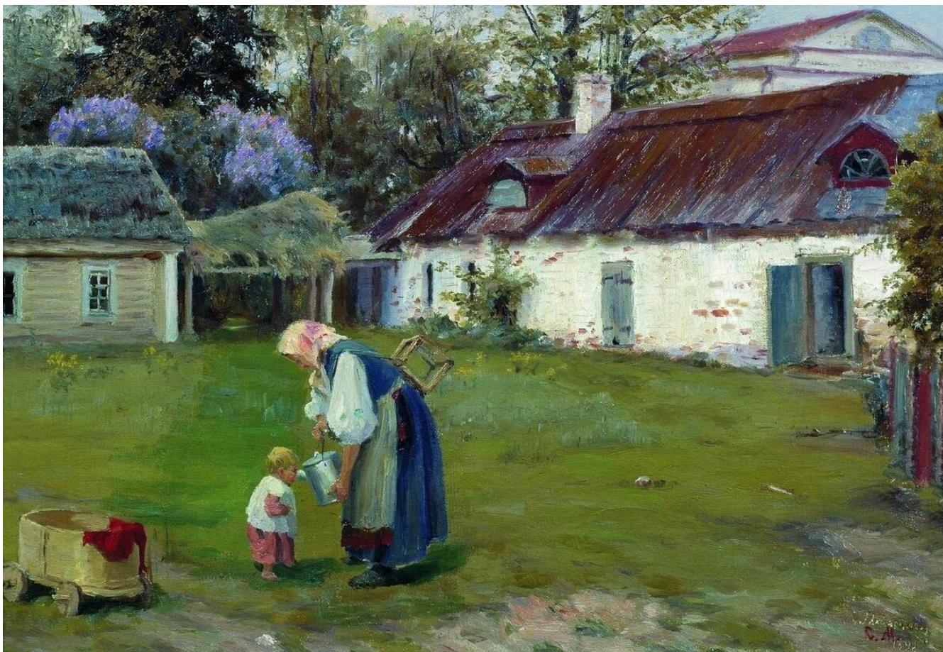
"С полудня", С.Д. Милорадович, 1899. Музей изобразительных искусств Калерии, Петрозаводск.