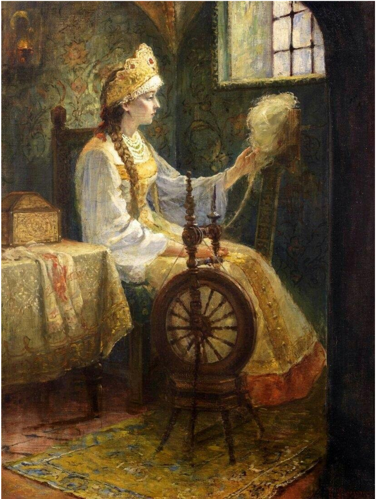
"Русская боярышня за прялкой", С.Д. Милорадович. Частное собрание.