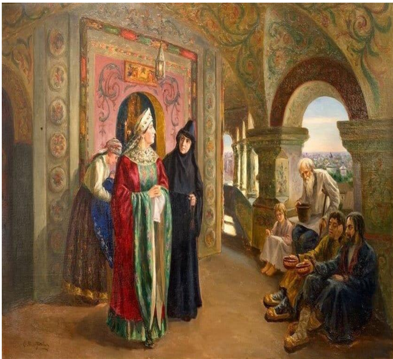
"Выход из церкви", С.Д. Милорадович, 1899. Музей истории религии, Санкт-Петербург.