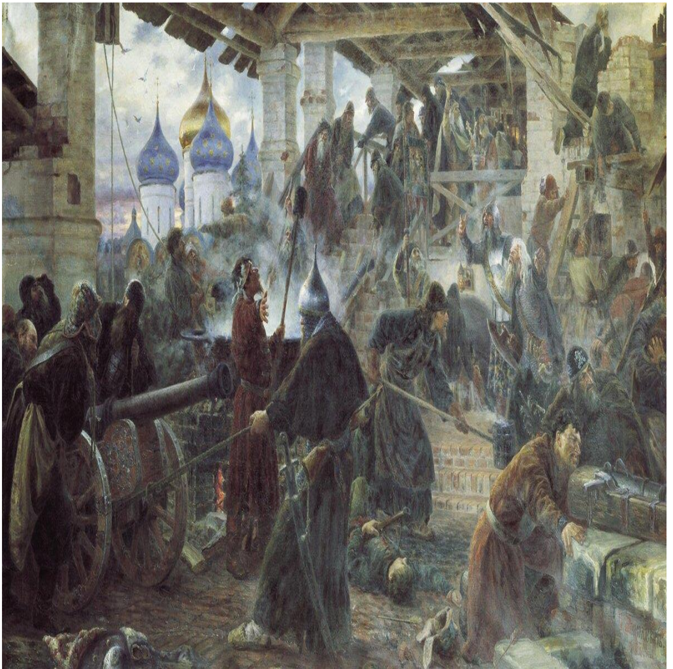
"Оборона Троице-Сергиевой лавры", С.Д. Милорадович, 1894. Русский музей, Санкт-Петербург.