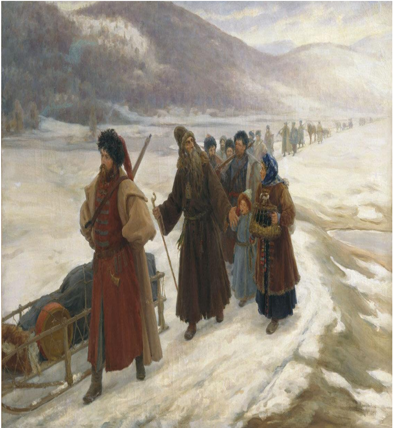
"Путешествие Аввакума по Сибири", С.Д. Милорадович, 1898. Музей истории религии, СПб.

Одна из наиболее известных картин С.Д. Милорадовича посвящена выдающемуся деятелю старообрядчества — священномученику и исповеднику протопопу Аввакуму «Путешествие Аввакума по Сибири» 1898 г. (Хранится в Государственном музее истории религии в Санкт-Петербурге. ). На полотне изображена одна из сцен «Жития протопопа Аввакума, им самим написанного» — ссылка в Сибирь.