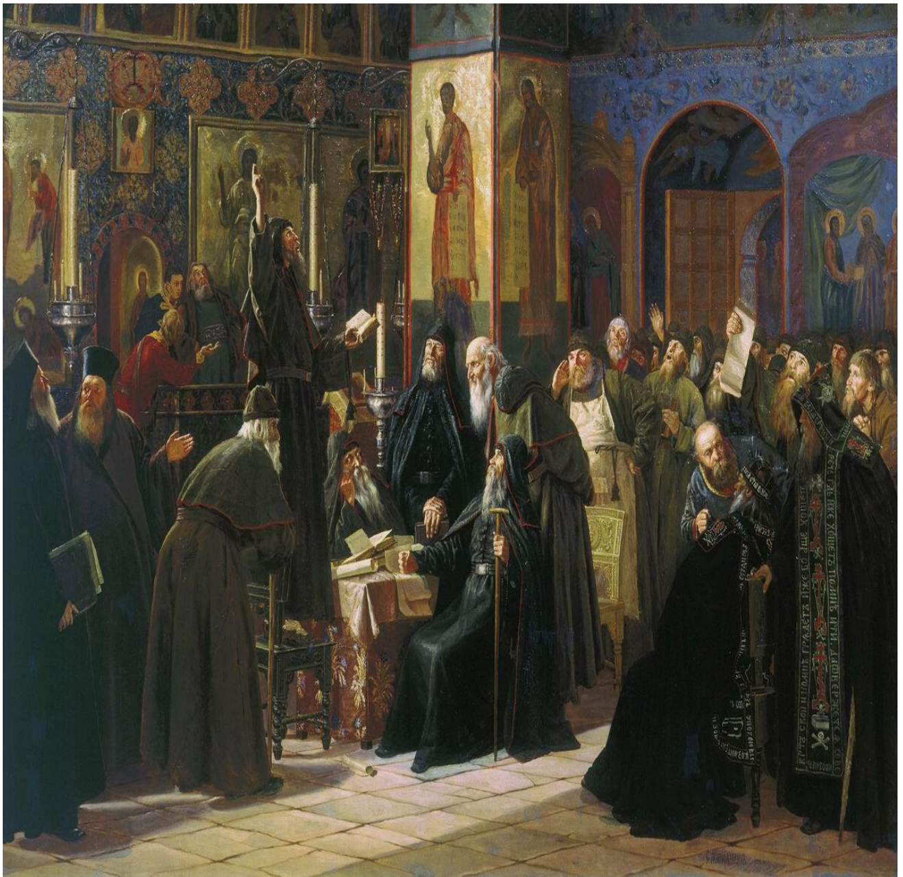
"Черный собор. Восстание Соловецкого монастыря против новопечатных книг в 1666 году", С.Д. Милорадович, 1885. Третьяковская галерея, Москва.