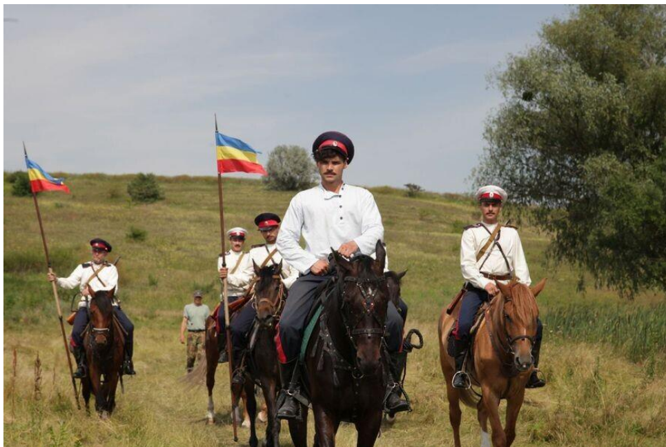
Головными уборами были фуражка и папаха.