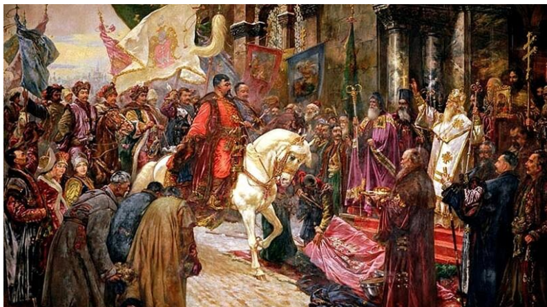
Известный казак Богдан Хмельницкий