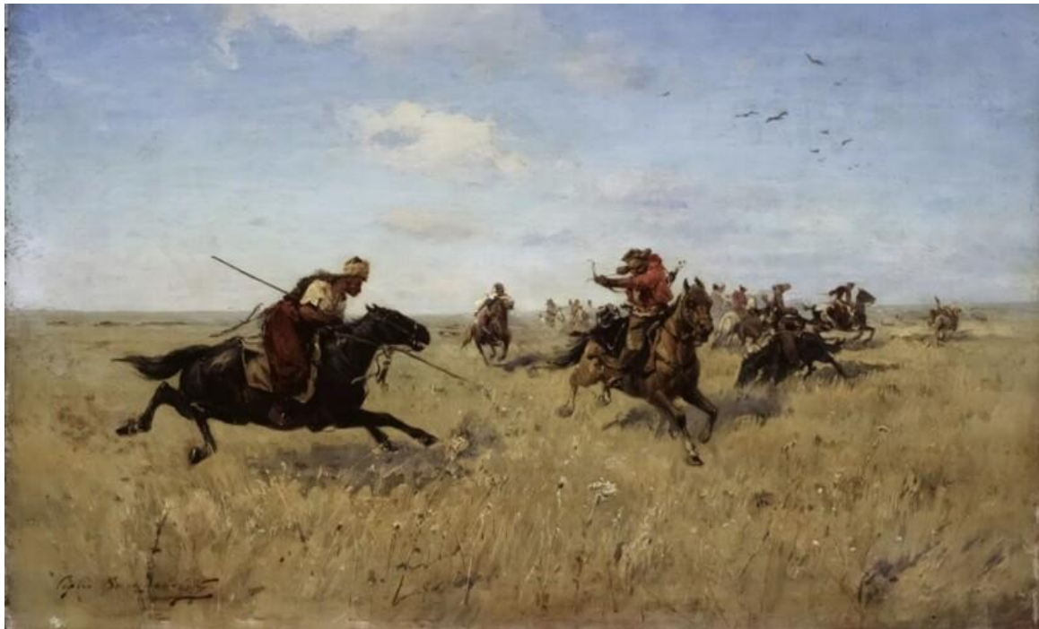
Дикое поле — место проживания первых казаков