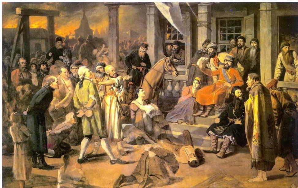
Пугачевское восстание с участием казаков

Одним из самых масштабных стало восстание Пугачева. Бунт подняли яицкие казаки в 1773 году, а вылилось все в кровопролитную войну крестьян против Екатерины II, которая продлилась 2 года.