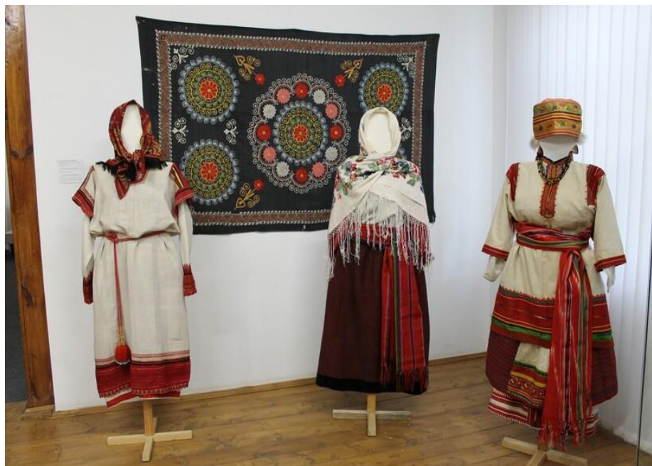
Национальные костюмы казачек

Обувь у женщин была удобная, мягкая, ярких цветов. Преимущественно сапоги с высоким голенищем.