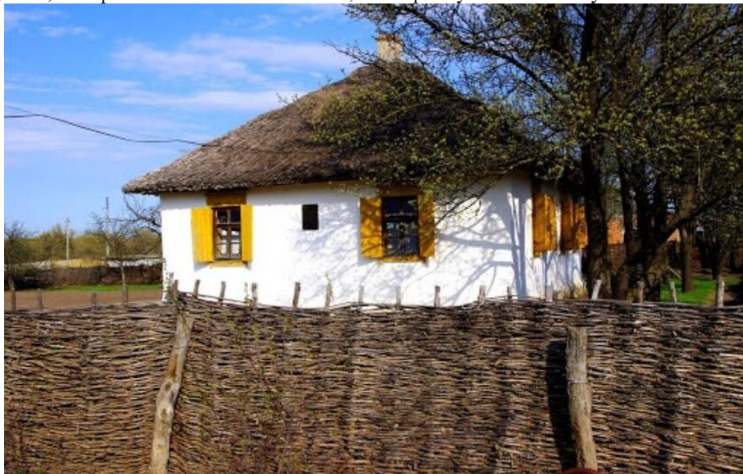
Типичный казачий дом

С годами они научились возводить более сложные постройки и стали жить в так называемых хатах — домах, которые обмазывались глиной, а на крышу клали солому.