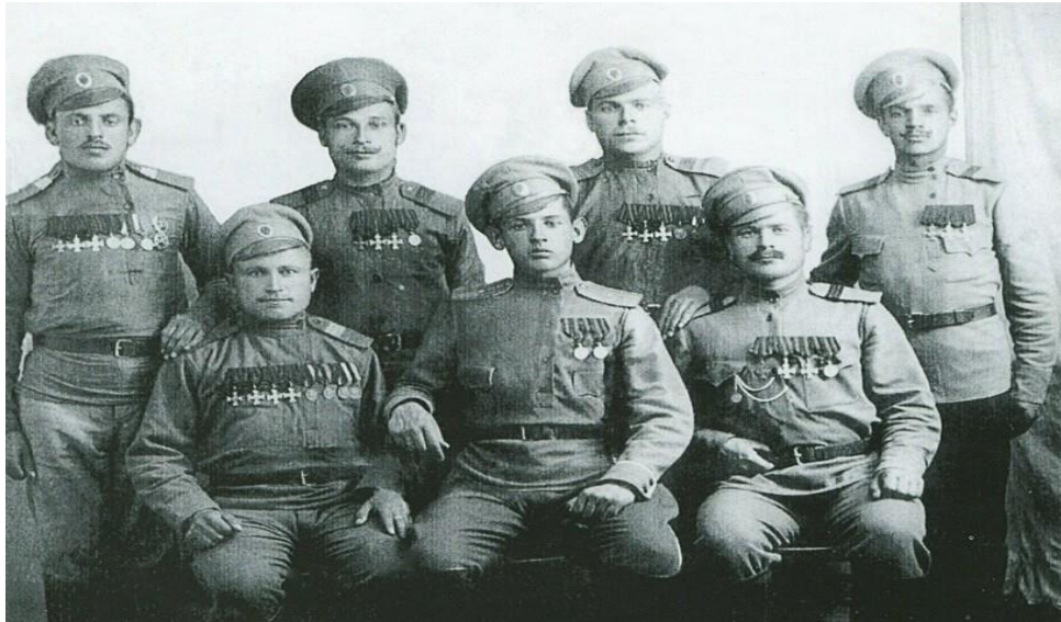
Казачи участвовали в Первой мировой войне смело и самоотверженно