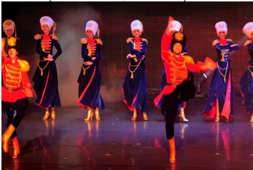
Танец казачок популярен до сих пор

Танец стал настолько популярным, что в XVII веке его ставили даже известные театральные труппы, правда, на свой манер. Кто-то как балет, кто-то как кадрили.