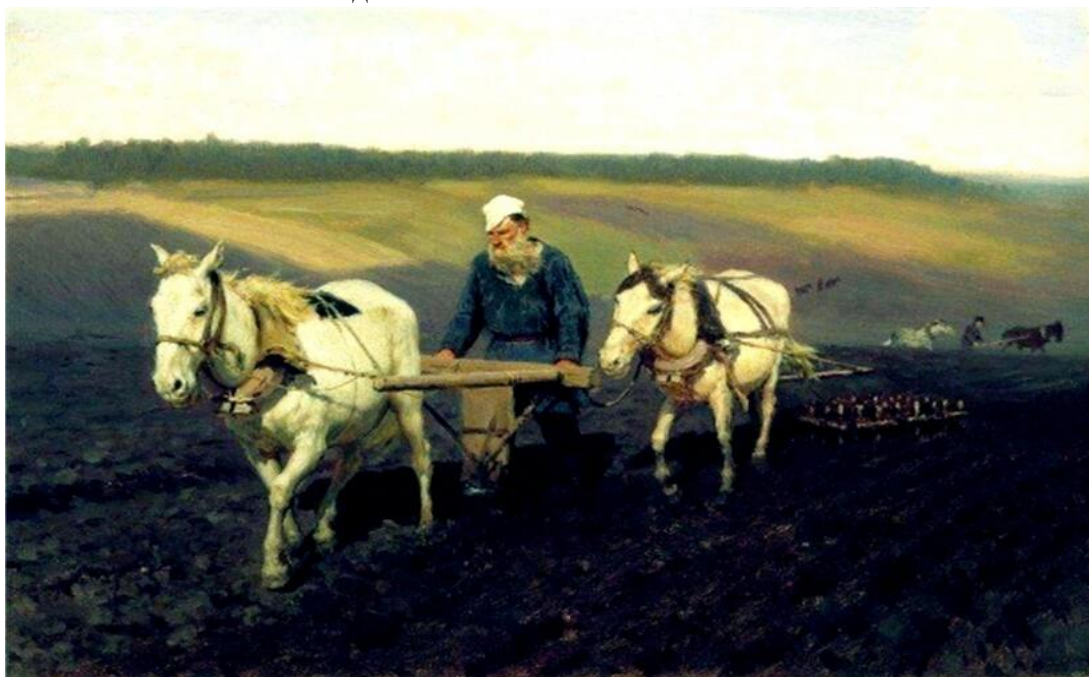
Казак занимается земледелием

Со временем в казачьих поселениях стало развиваться животноводство. Стали разводить коней, овец, на Урале — верблюдов. Вблизи крупных рек также занималось рыболовством. В XIV веке казаки освоили и земледелие.