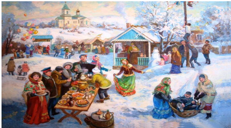
Масленица — один из любимых праздников у казаков

К Пасхе всегда прибирали дома и двор, накрывали белые скатерти, обязательно мылись в чистый четверг.