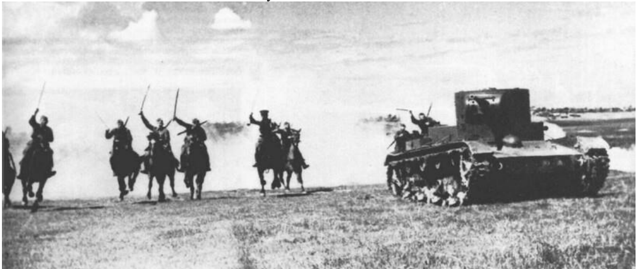
Из казаков формировали конно-танковые дивизии

Лишь через два года казаков стали объединять с танковыми подразделениями. Коней использовали для быстрого перемещения, а сами казаки служили в качестве пехоты. Также представители казачества воевали в пластунских дивизиях.