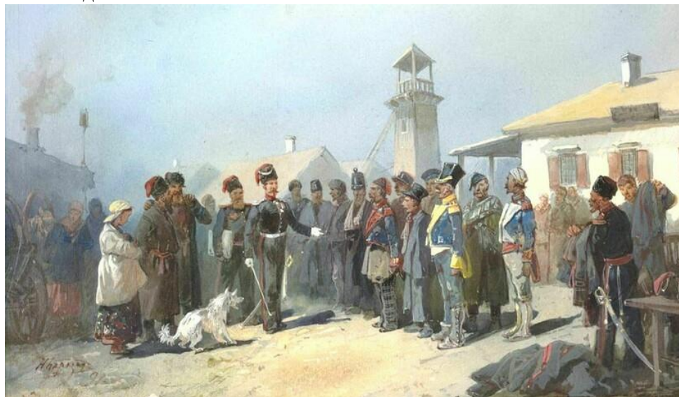
Атамана казаки выбирали путем голосования

Атаман — это предводительства всего казачьего войска, их старшина. Войскового атамана выбирали ежегодно на народном собрании — все казаки вставали в круг и голосовали за того или иного представителя казачества. Нередко выборы заканчивались другой — настолько ожесточенными были дебаты.