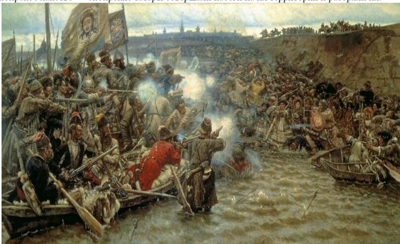
Поход Ермака в Сибирь

Большое историческое значение имеет поход Ермака в Сибирь, с которого и началось освоение этих территорий. К донцам за помощью обратились купцы Строгановы, которых третировало Сибирское ханство — сибирские татары совершали набеги на их территории и разоряли их.