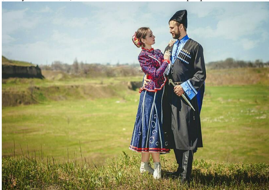
Фото казака со своей женой

веселых, никогда не унывающих, сильных женщин. И очень храбрых.