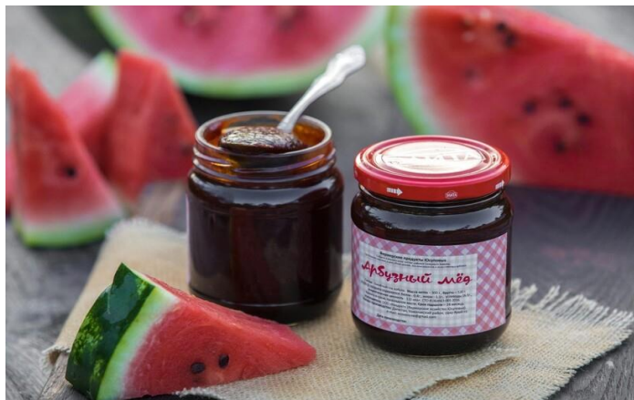
Арбузный мед — традиционный десерт у казаков

В качестве холодных закусок традиционно делают студни, языки, варят мясо диких животных. Сейчас кухня казаков стало ещё разнообразнее — в неё вошли борщи, рыба, фаршированная крупами, шашлыки, пельмени и вареники.