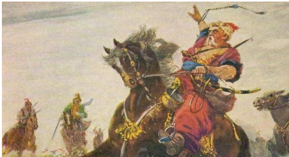
Тарас Бульба — один из самых известных казаков

Кто такие казаки? Мы уверены, у большинства людей знания об этом народе весьма поверхностны и получены, по большей части, из художественной литературы. Все мы помним Тараса Бульбу и его сыновей, Гришку Мелехова, молодого Левка... Многие думают, что казаки жили давно, причём только в России и Украине. А между прочим, они и сейчас проживают в этих странах и других европейских странах, а ещё — в Азии.