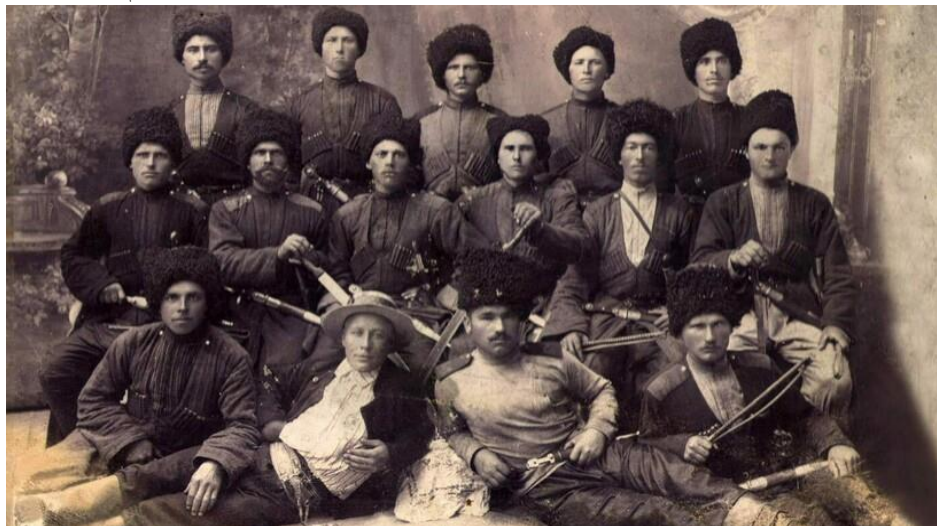
Казаки — гордый и свободолюбивый народ

Одни считают, что казачество образовали беглые крестьяне и холопы, которые бежали из Руси в Дикое поле (безлюдные степи между Днестром и Доном), обосновались там и регулярно привечали новых беглецов.