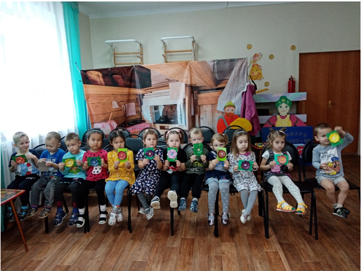
А зрители - свою дидактическую игру.