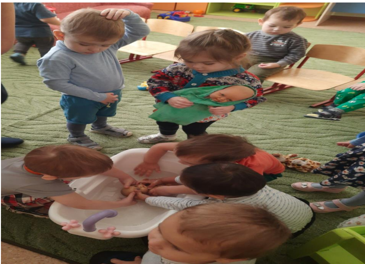
Чтение К. Чуковского «Мойдодыр».