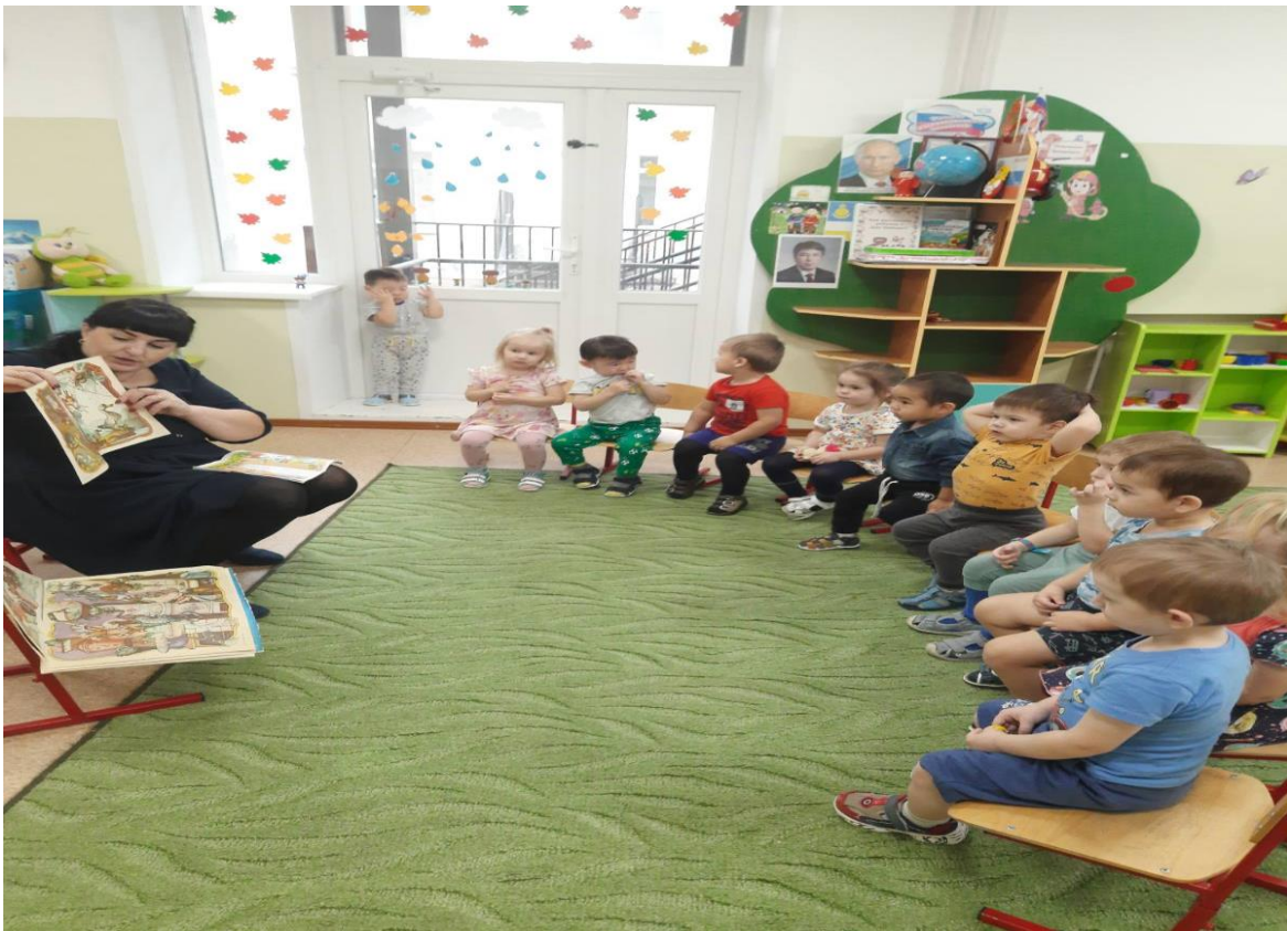
Игра «Приключение мыльного пузыря». Чтение К. Чуковского «Мойдодыр».