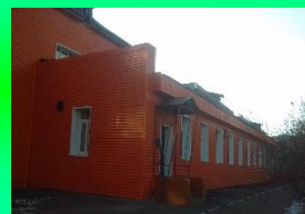
д/с №161 «ЕЛОЧКА»