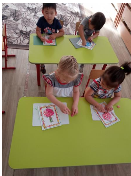
Пластилинография «Чудесные цветы»

Коллективная работа и оформление поздравительной стенгазеты.