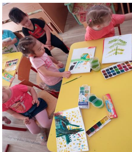
Рисование «Веточка мимозы»